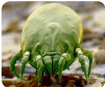
تصویر ۳: ماییت

هییره‌ها بندپایانی میکروسکوپی هستند (حدوداً ۰/۳ میلی‌متر) که با چشم غیرمسلح دیده نمی‌شوند. تغذیه این موجودات از پوسته‌ریزی بدن انسان است. محل زندگی این حیوان در لابه‌لای پرزهای فرش، پتو، میلمان، پرده، تشک، بالش، اسباب بازی‌های پشمی و پارچه‌ای و وسایل مشابه است. شرایط آب و هوایی گرم مرطوب - (مثلاً در زمستان که اکثراً درب و پنجره‌ها بسته است و اغلب از بخور نیز