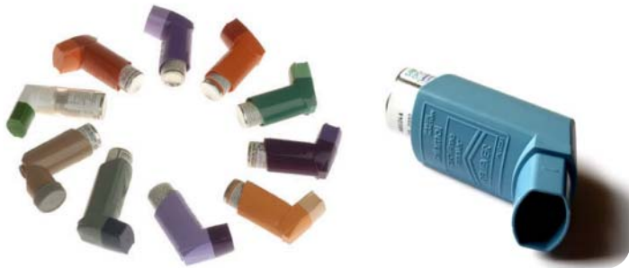
تصویر ۷: افشانه یا MDI