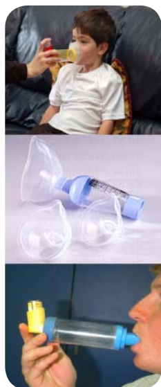
تصویر ۶: محافظه مخصوص