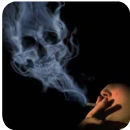
تصویر ۴: دودسیگار