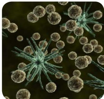
تصویر ۵: گرده‌ها

گرده‌های گیاهی موجود در فضا، اغلب سبب آسم و آلرژی‌های فصلی می‌شوند. درختانی مثل نارون، کاج، سپیدار، علوفه‌های هرز در فصول مختلف مشکل‌ساز هستند. در فصل‌های گرده‌افشانی با بستن درب و پنجره‌ها می‌توان از نفوذ گرده‌ها به اتاق جلوگیری کرد. رطوبت و گرما سبب رشد قارچ‌ها و کپک‌ها می‌گردند، کپک‌ها و قارچ‌ها از عوامل آلرژی‌زا در فضاهای بسته به شمار می‌روند. لذا باید از منابع تکثیر قارچ مثل جاهای مرطوب اجتناب کرده و محل‌های مرطوب (حمام و زیرزمین) مکرراً تمیز شوند. نگهداری گلدان‌های زینتی و متعدد در کلاس باعث افزایش قارچ‌ها و کپک‌ها می‌شوند.